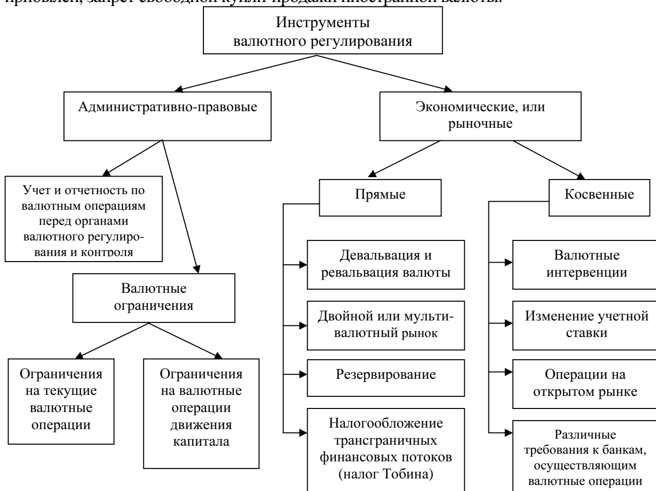
Рис. 3. Инструменты валютного регулирования

Автор выделяет две группы инструментов валютного регулирования: административно-правовые и экономические (или рыночные). (Рис. 3) Введение административно-правовых инструментов валютного регулирования предполагает определение порядка осуществления операций с валютными ценностями посредством прямых запретов, прямых количественных ограничений или утверждения четких процедур реализации этих операций. Административно-правовое регулирование обычно оказывает прямое влияние на объем и цену осуществления валютных операций, охватывая международные платежи и переводы капитала, перемещение золота, денежных знаков и ценных бумаг, репатриацию экспортной выручки, прибылей, запрет свободной купли-продажи иностранной валюты.