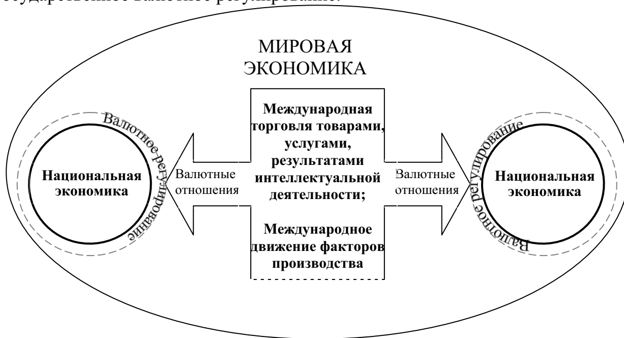
Рис. 1. Валютное регулирование в системе международных экономических отношений

Усложнение характера международных отношений в связи с существенным расширением спектра предлагаемых товаров, услуг, результатов интеллектуальной деятельности, усилением международного движения факторов производства привело к необходимости урегулирования государством валютных отношений, возникающих в результате проведения международных операций. (Рис. 1) В условиях рыночной экономики, помимо государственного валютного регулирования, существует и «стихийное» рыночное регулирование валютных отношений, обеспечивающее относительную эквивалентность обмена валют, соответствие международных финансовых потоков потребностям мирового хозяйства. Государственное валютное регулирование позволяет ограничить негативные последствия рыночного регулирования валютных отношений. В работе под валютным регулированием мы понимаем государственное валютное регулирование.